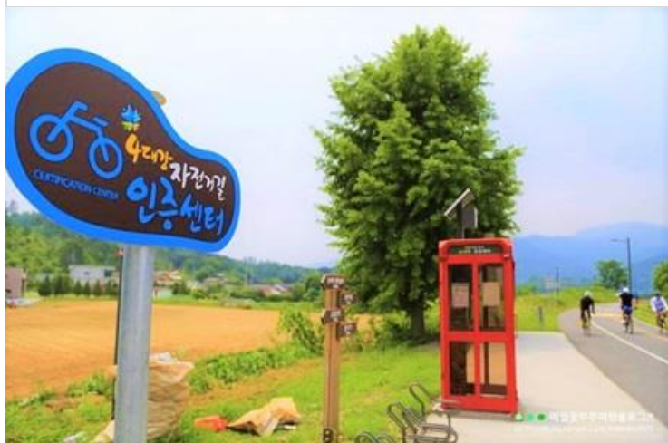
踏單車悠閒遊 首爾近郊