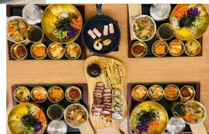
韓式海陸雙拚套餐