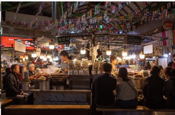
韓國本土國民美食街【廣藏市場】