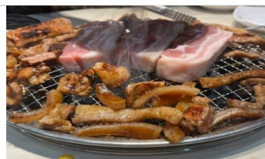
明倫進仕 PORK BBQ