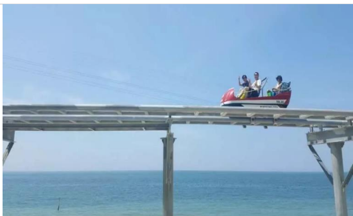
天空鐵路單車 SKY RAILBIKE