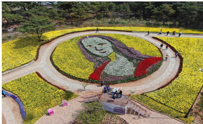
泰安郡鬱金香慶典