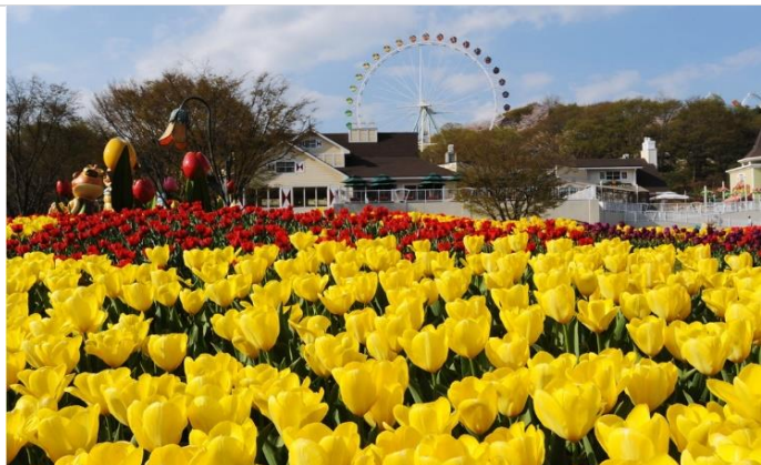
世界三大鬱金香慶典