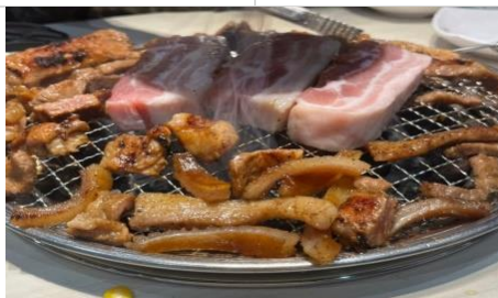
明倫進仕 PORK BBQ