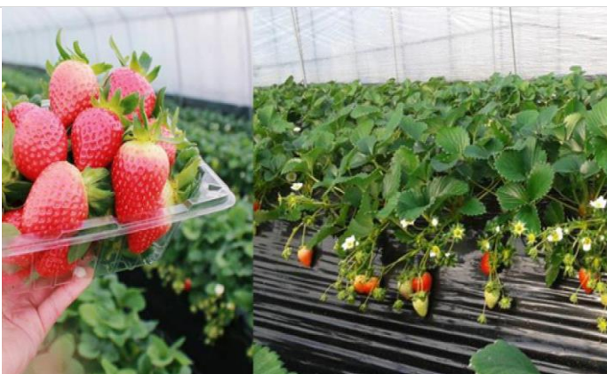
士多啤梨園 / 採士多啤梨