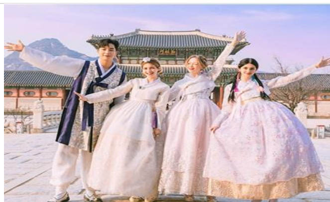
【最美宮殿】景福宮 傳統韓服體驗